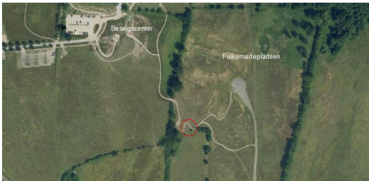
Speakers Corner placeres på Folkemødepladsens vestlige skråning i en gryde, der giver mulighed for at sidde i græsset med front mod den lille scene. Scenen etableres inden for området markeret med rød cirkel.

Det fremgår af ansøgningen at scenepladsen landskabeligt ligger sig naturligt ind i terrænet med en støttemur udført i marksten og kampesten i forskellig størrelse. De nederste sten sættes i jordvådt linjefundament, for at forhindre jorderosion. Selve scenegulvet udføres med et 10 cm stampet top lag af slotsgrus oven på råjorden. Det fremgår endvidere at udtryksmæssigt læner scene sig op af den historiske talerstol og benytter samme materiale som på Skamlingsbankens øvrige pladser og stier. Scenens diameter bliver ca.10 m.